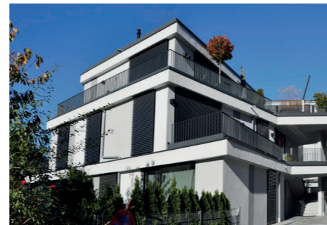
CAPITOL TERRASSEN ROSENHEIM, 2014-2015