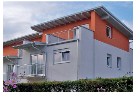
MEHRFAMILIENHAUS ROSENHEIM, 2005-2006