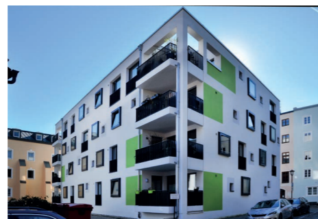
K13 I MEHRFAMILIENHAUS WASSERBURG, (2013-2014)