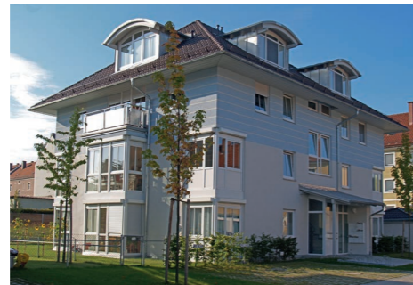
MEHRFAMILIENHÄUSER ROSENHEIM, 2003-2004