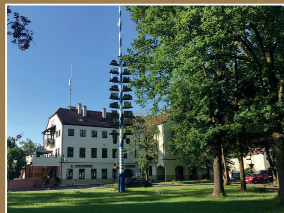
Der Alte Wirt in Großkarolinenfeld - eine von vielen Einkuhmöglichkeiten