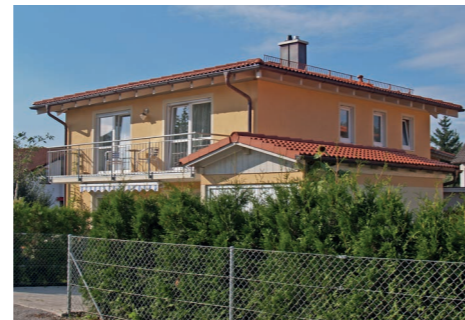
TOSKANAHÄUSER ROSENHEIM, 2002-2003