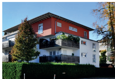
KASTANIENHOF I MEHRFAMILIENHÄUSER ROSENHEIM, 2005-2006