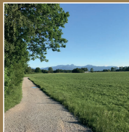
Natur pur vor der Haustüre - wohnen, wo andere Urlaub machen