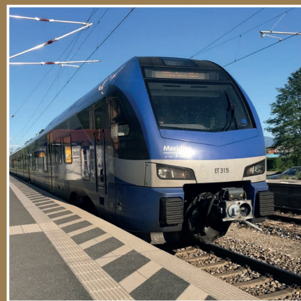
Mit dem Meridian in nur 8 Minuten nach Rosenheim und in 49 Minuten nach München