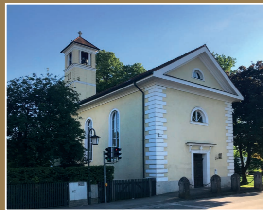
Die Karolinenkirche von 1822 im Ortskern