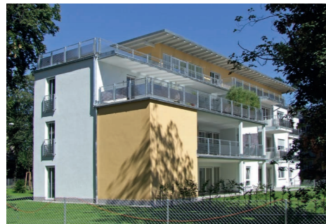
PRINZREGENTENPARK I MEHRFAMILIENHÄUSER ROSENHEIM, 2007-2008